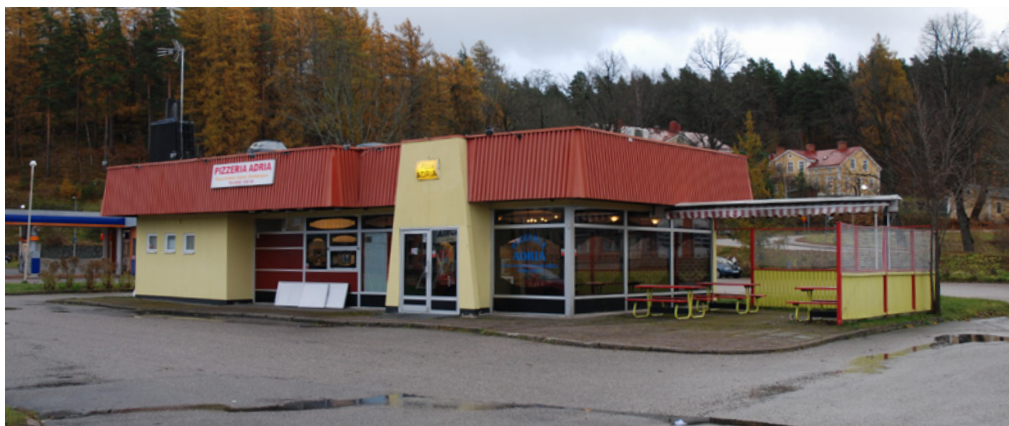
Ett gatukök uppfördes i anslutning till den gamla motorvägssträckningen genom Arboga, E3:an, söder om stadskärnan.