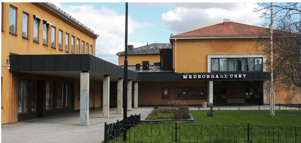
Medborgarhuset byggdes 1948 i stadskärnans norra del.