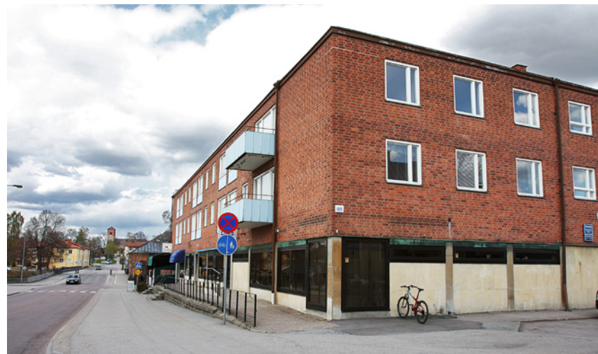
Byggnadsfirman Henry Ståhl uppförde ett bostads- och affärshus vid Herrgårdsgatan 1957–58.