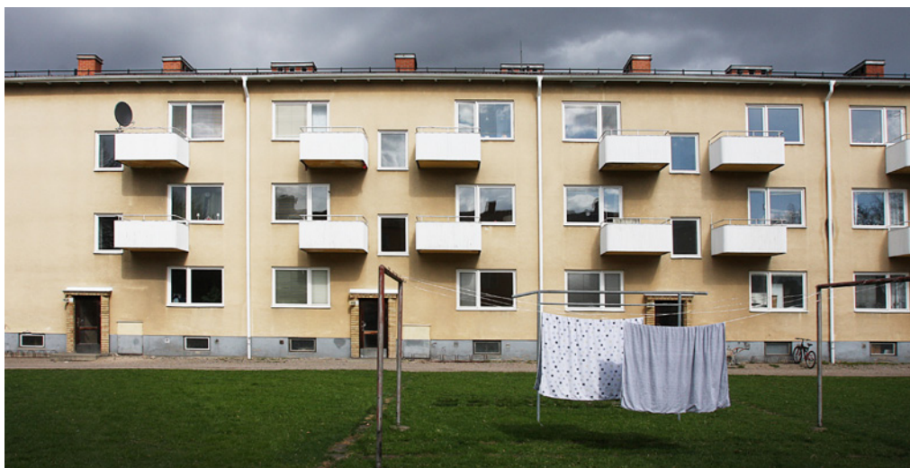
I Vasastadens nya hyreshus byggdes i form av trevånings lamellhus.