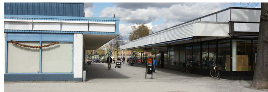
1969 byggdes både ett Domus- och ett Epa-varuhus vid Ahllöfsgatan och Nytorget ersatte därmed Stora torget som handelsplats.

I slutet av 1960- och början av 70-talet revs en hel del äldre