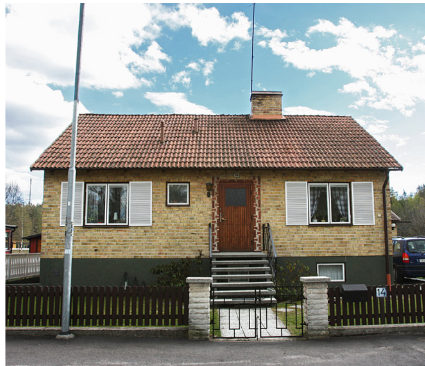
Egnahem på Sjukhusgården.

Den stora utbyggnaden av bostäder i Arboga under 1960- och 70-talen gjordes på Brattberget och i Strömsnäsområdet, norr om Brattberget. Här uppfördes flerbostadshus i två etapper, bland annat fyra punkthus i sju våningar 1966. Brattberget byggdes kontinuerligt ut med nya bostadsgrupper. Mellan husgrupperna anlades ett större parkstråk med gångvägar