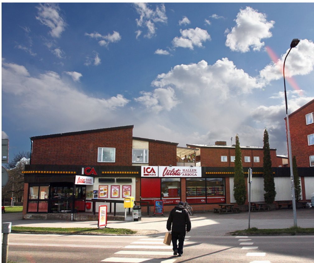
Stadsdelscentrum i Vilsta väster om stadskärnan.