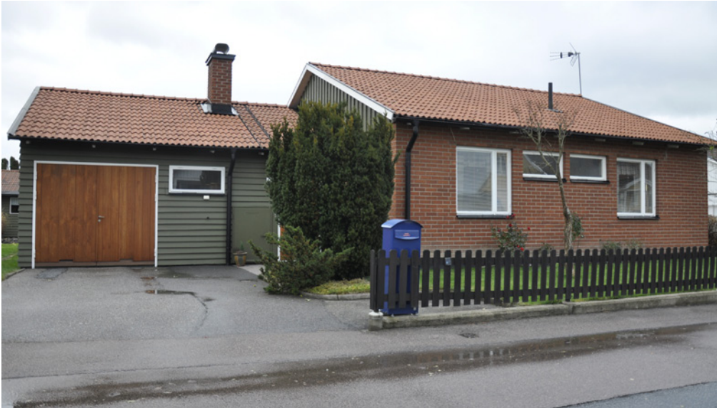
Arbogavillan uppfördes bland annat på Sjukhusgården. Enfamiljshuset producerades av Byggnadsfirman Hilding Lund.