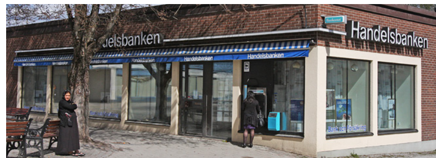
Svenska Handelsbankens byggnad togs i bruk 1974. Ritad av arkitekten Gunnar Hallén, uppförd av byggnadsfirman Hilding Lund AB.

bebyggelse i den södra stadsdelen och flera nya byggnadsprojekt startades.