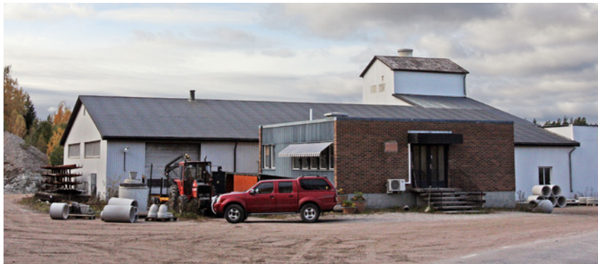
Cementvarufabriken i Lunger.

Snickeriverksamhet och möbelindustri växte fram under 1800-talets senare del och början av 1900-talet. AB Myrstedt & Stern Möbelfabrik och Arboga Snickerifabrik, som ägdes av Nordiska Kompaniet (NK) i Stockholm, var bland de större och mest kända. Myrstedt & Stern hade sitt huvudkontor på Kungsgatan i Stockholm, med inredningsarkitektbyrå, syateljé och utställningslokaler. NK köpte 1916 AB Arboga snickerifabrik som komplement till den snickerifabrik i Nyköping som man redan ägde.