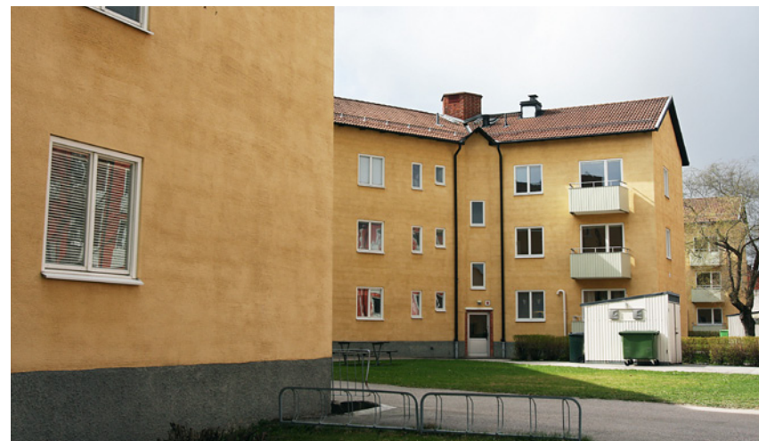
I Bland Vasastadens lamellhus fanns även stjärnhus.

Husen i Vasastaden följde funktionalismens lamellhusplaner där husen låg parallellt efter varandra på rad med tillgång till mycket ljus och luft. Husen ritades bland annat av stadsarkitekten Lars Arborelius som tillämpade de senaste rönen inom bostadsbyggandet genom att infoga 1940-talets nya hustyp stjärnhuset i området. Stjärnhusen erbjöd fina lägenhetsplaner och rumsskapande utomhusmiljöer.