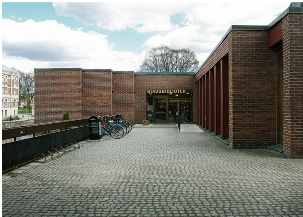
Det nya stadsbiblioteket byggdes vid Kapellgatan, vid åns södra sida.